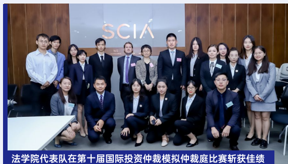
法学院代表队在第十届国际投资仲裁模拟仲裁庭比赛斩获佳绩

法学院与中国政法大学合作，每年选派30名学生参加中国政法大学夏季学期全英授课国际课程。课程涵盖涉外法务、区域国际法、德国法案例分析、全球治理与国际制度、领导力及地方政府管理等多个领域。学生可以根据自己的专业和兴趣选取其中两到三门课程，通过小班教学、开放式讨论、模拟法庭等多种形式，开阔视野，接纳新知，并可获得1-2个学分。