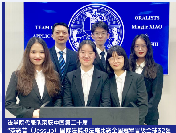
法学院代表队荣获中国第二十届“杰赛普（Jessup）国际法模拟法庭比赛全国冠军晋级全球32强

法学院致力于提升毕业生的职业技能，增强毕业生的就业竞争力。近年来，法学院开展了人力资源管理师等一系列职业技能培训，学生在法律职业资格考试中已连续多年取得佳绩，2022年通过率为72.8%，远高于全国平均水平。2022年法学专业升学率34%，大部分学生到北京大学、清华大学、复旦大学、中国政法大学、中国人民大学、华东政法大学、中南财经政法大学、西南政法大学、中国科学院大学、波士顿大学、美国南加州大学、美国乔治城大学、英国道格拉斯大学、悉尼大学、澳洲国立大学、香港中文大学、香港城市大学等境内外知名院校升学深造。超过60%的毕业生就业于珠三角、长三角、京津冀等地区。