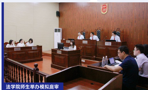
法学院师生举办模拟庭审