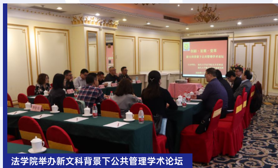
法学院举办新文科背景下公共管理学术论坛